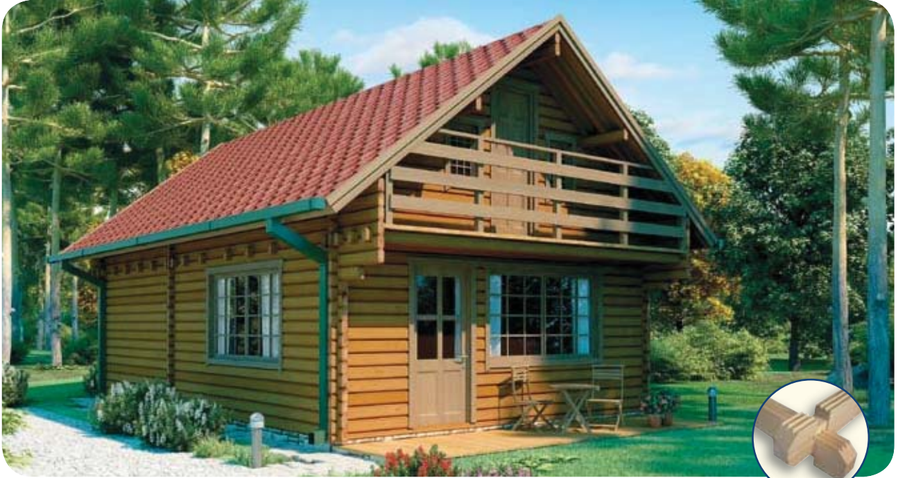
Chalet 2 étages total 95 M 2