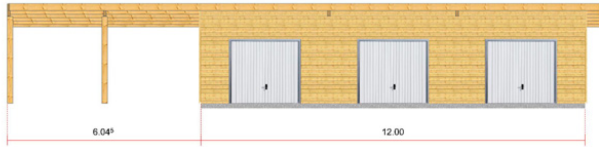
Plan du garage bois